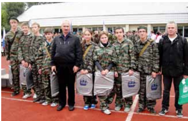
Игра «Зарница». Команда 278-й гимназии