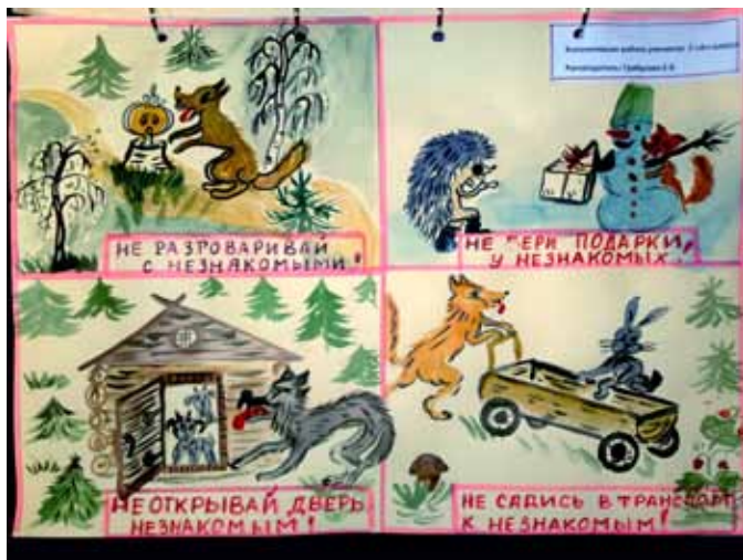
Конкурс детского рисунка

Первоочередными задачами органов местного самоуправления МО МО Екатеринбургский в сфере правопорядка и безопасности стали обеспечение безопасности личности и общества, профилактика терроризма и экстремизма, совершенствование деятельности по гражданской обороне и предупреждению чрезвычайных ситуаций природного и техногенного характера на территории муниципального образования.