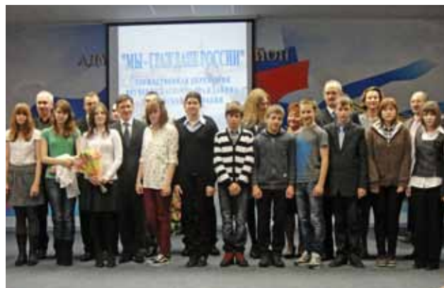
Всероссийская гражданско-патриотическая акция «Мы — граждане России!»