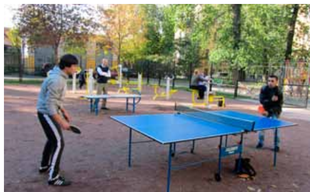
ул. Курляндская, д. 22—24