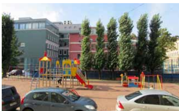
Рижский пр., д. 62

Обустройство и ремонт спортивной площадки проведен по адресу: ул. Курляндская, д. 22—24. Отремонтировано набивное покрытие, установлены тренажеры, стол для тенниса, стойки для волейбольной площадки. Установлено металлическое ограждение и выполнены работы по озеленению.