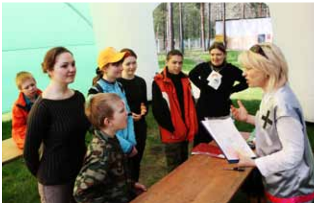
День семьи. Выезд за город