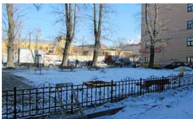
Лермонтовский пр., д. 49—51