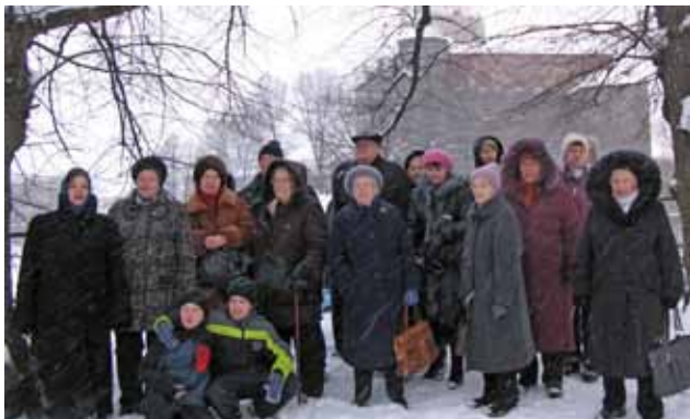
Экскурсия в город Выборг

Также не остались без внимания депутатов опекаемые дети, проживающие на территории округа. При участии органа опеки и попечительства местной администрации организовано проведение конкурса творческих работ среди опекаемых детей. Все участники были награждены подарками.