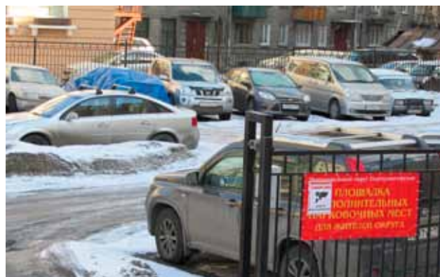
наб. реки Фонтанки, д. 164