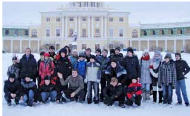
Экскурсия в город Павловск