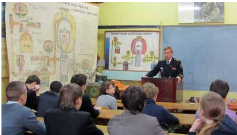
Депутат МС МО МО Екатерингофский проводит занятие со школьниками округа

В рамках реализации ведомственной целевой программы «Участие муниципального образования муниципальный округ Екатерингофский в мероприятиях по гражданской обороне и защите населения от чрезвычайных ситуаций природного и техногенного характера в 2012 году» в МО МО Екатерингофский продолжает работу созданный в 2007 году и оборудованный учебно-консультационный пункт, предназначенный для обучения неработающего населения, проживающего на территории муниципального образования, основам безопасности жизнедеятельности.