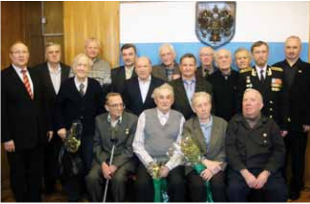
День защитника Отечества